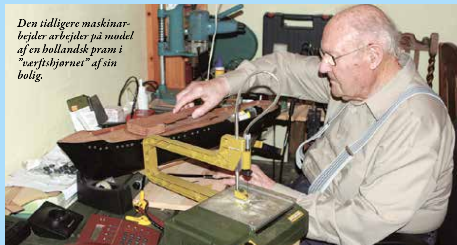
Den tidligere maskinarbejder arbejder på model af en hollandsk pram i ”værftshjørnet” af sin bolig.