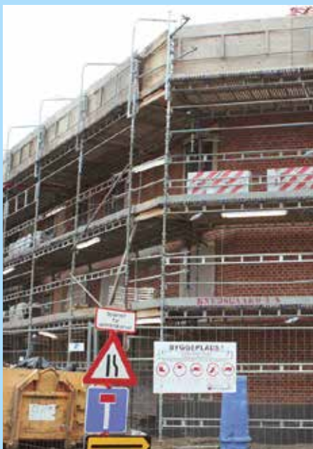
På hjørnet Jernbanegade-Østergade i Løgstør skal 12 boligers renovering være klar til maj.