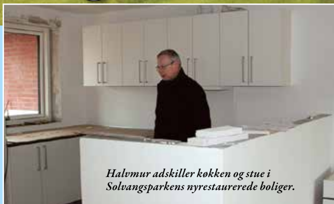
Halvmur adskiller køkken og stue i Solvangsparkens nyrestaurerede boliger.