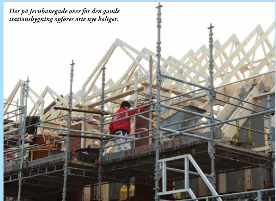
Her på Jernbanegade over for den gamle stationsbygning opføres otte nye boliger.