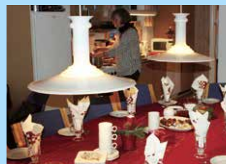
Boligforeningens kontor var smukt pyntet op til julekomsammen.