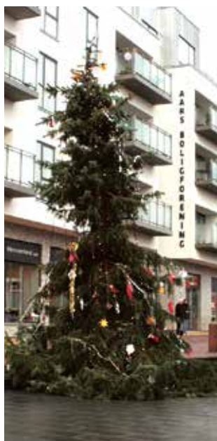
Her Danmarks grimmeste juletræ foran nærmeste nabo – Aars Boligforening.