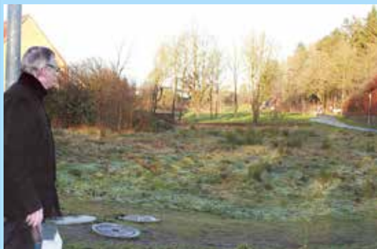
Direktør Jens Damgaard ved Skøjtesøen/Tingvej.

Vesthimmerlands Kommune havde pr. 1. januar 2018 et indbyggertal på 37.267. Det er næsten status quo i forhold til 1. januar 2017, da kommunen havde 22 flere indbyggere. Ser vi på en lidt længere periode, var indbyggertallet 1. januar 2007 på 37.841 – eller 574 flere end nu.