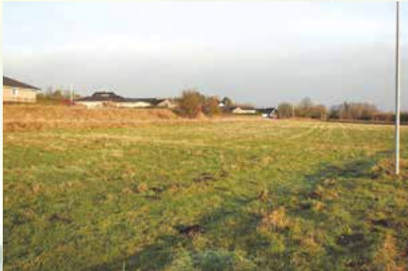
Klokkelyngen opføres på dette areal.