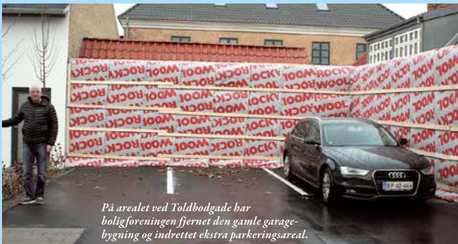
På arealet ved Toldbodgade har boligforeningen fjernet den gamle garagebygning og indrettet ekstra parkeringsareal.